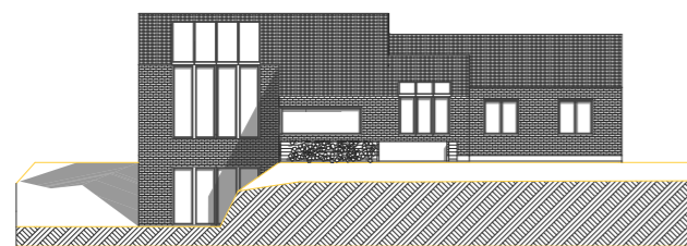
Facade mod NV u. målestok