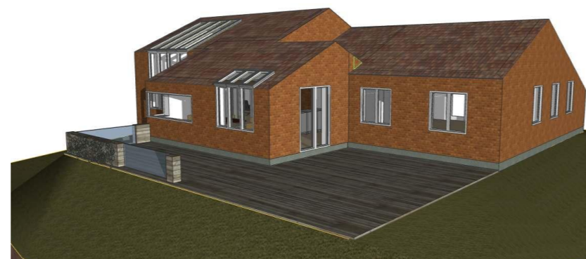
Perspektiv mod vest

Note: Tilbygning 20,5 m 2 mod NV erstatter eksisterende parabelformet tilbygning i samme retning. Den nye tilbygning følger husets hovedform, hvor det eksisterende tegltag forlænges ud i haven med samme taghældning. Tilbygningen bygges samtidig ind i den eksisterende store opholdsstue. Udvidelsen af det eksisterende køkken følger denne tagflade, men bøjer af mod den laveste del af den eksisterende tagflade. Materialer er som eksisterende: Blankt murværk og tegltag. Der isættes ovenlysvinduer både i spisestue og køkkendel, som vist.