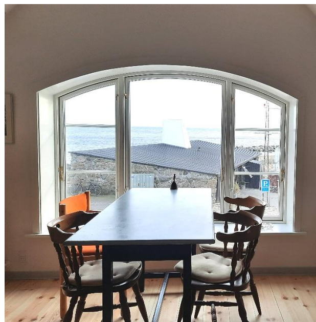
Gavlindue med havudsigt

Ved valg af materialer har levetiden været en stor vægtning omkring klimaskærmen som har været den primære renoveringsprioritering omkring dette projekt, samt hele første salen for at danne brugbare rammer for foreningslivet og især de turister som kommer og lægger til i Svaneke havn. Renoveringen har udover robuste materialer fokuseret på at reducere varmetab. Med respekt for husets stil og byggeskik. Der er isat stilmæssigt tilpassede vinduer med 3-lags glas, og tagkonstruktionen samt gavlene er efterisoleret. Derudover er taget lavet med fast undertag og dermed en meget lang levetid. Inddækninger og nedløb er udført i zink.