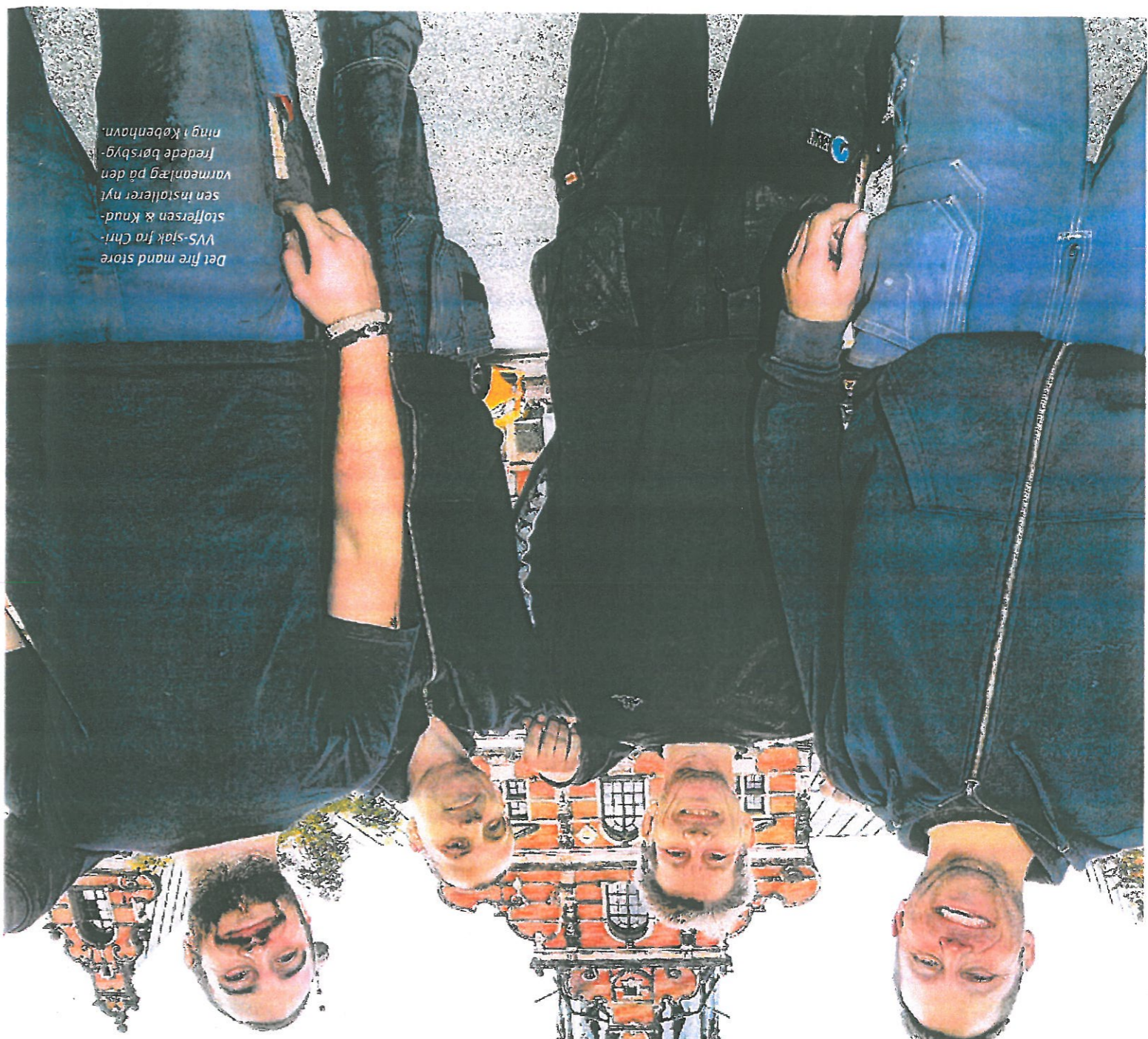
Del fire mand store VVS-sjak fra Christoffersen & Knudsen installerer nyt varmeanlæg på den fredede børstbygning i København.

En komplet udskiftning af varmeanlægget i den smukke og fredede børstbygning! Københav kræver unikke løsninger, godt håndværk og respekt for den danske kulturarv.